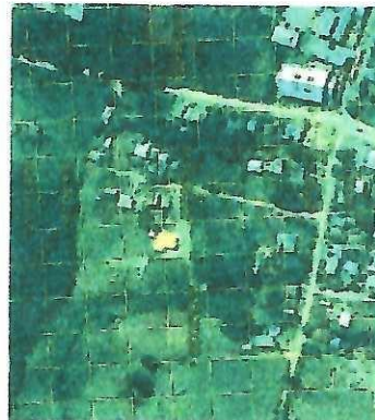
FOTO DO LOCAL

COM EXTENSÃO QUE SERÁ ABERTA DE 82 METROS DE COMPRIMENTO E 10 METROS DE LARGURA